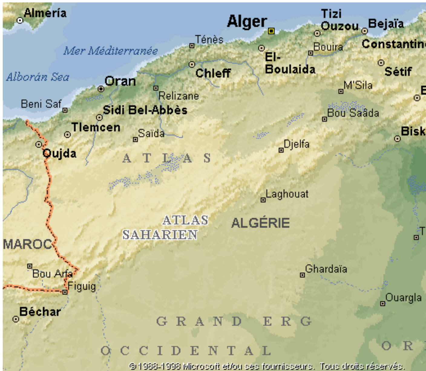
CARTE N°4 : PRINCIPALES VILLES D'ALGERIE