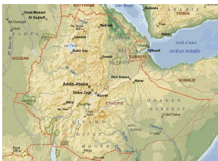
Figure 7: Carte de l’Ethiopie

La vision, qui considère l’Ethiopie comme résultant d’une opposition séculaire entre chrétiens et musulmans , entre sémites et couchites , entre hautes terres et basses terres , entre nomades éleveurs et céréalicultures sédentaires ..., s’efforce de faire entrer dans ce système binaire le passé , le présent et l’avenir de ce pays et de la corne de l’Afrique . Elle fait bon marché de l’autonomie propre à chacune de ces dimensions culturelles , introduit un déterminisme réducteur et surtout abolit la personnalité des populations nombreuses qui ne rentrent pas dans les deux moules : que fait-on des peuples omotiques , des planteurs , des arboricultures ? Que fait -on de l’Ethiopie autre, " heureuse "? L’étude de Gryseelset Anderson classe les hauts plateaux éthiopiens en zones agro-écologiques selon leur aptitude à la production agrovégétale (Gryseels et Anderson, 1985).