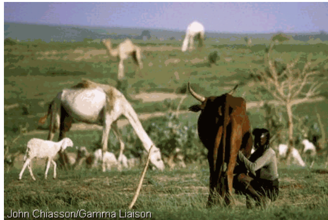
Figure 3: Elevage au Tchad

L'élevage, contribue de façon importante à l'autosuffisance alimentaire et à l'accroissement des recettes d'exploitation. Il représente, 12,76% du PIB. L'exploitation du bétail sur pied, reste dominante et elle se fait surtout en direction du Nigeria , du Cameroun ,et de Centrafrique. L'exploitation de la viande, se fait à partir de N'Djamena qui dispose d'infrastructures adéquates tant au niveau de l'abattoir de Farcha que de l'aéroport . Les exportateurs de viande, tentent de reconquérir le marché d'Afrique centrale .Outre le Congo ,des opérations sont menées en direction du Gabon compte tenu du phénomène de la sécheresse. Les éleveurs particulièrement dans la zone sahélienne, sont en train d'évoluer dans leurs comportements, ils manifestent une tendance à se sédentariser dans les zones qui s'y prêtent en assortissant leur activité principale d'une activité secondaire .Dans l'éventail de l'agriculture ,seul l'extrême nord du pays échappe au schéma qui sensiblement se dessine. Le Tchad, a été un moment concurrencé par l'irruption de la viande surgelée en venant d'Europe .