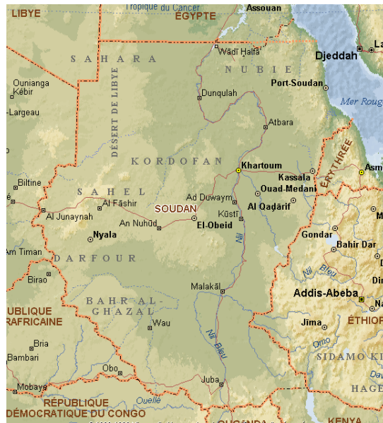
Figure 5: Carte du Soudan