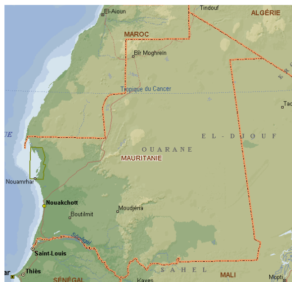
Figure 6: Carte de la Mauritanie

Tableau: données démographiques et économiques de la mauritanie