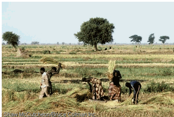
Figure 2: Agriculture au Tchad

Il faut aussi parler de l'importance de l'élevage et de l'agriculture sur le plan national .