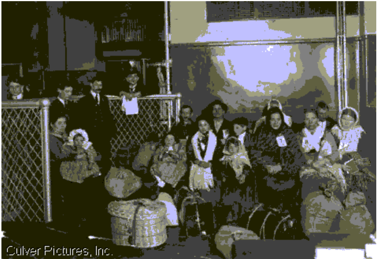
Immigrants arrivants à Ellis Island d'après l'encyclopédie Encarta