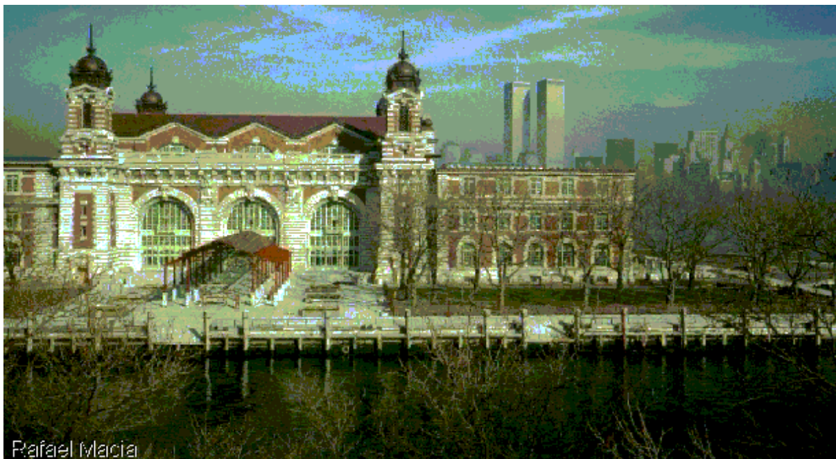
Ellis Island d'après l'encyclopédie Encarta

sous la direction de Jacqueline COSTA-LASCOUX