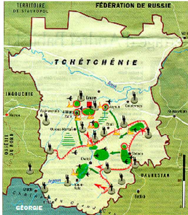
Carte XI : situation le 8 février 2000