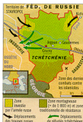
Carte VII : Situation le 1 er octobre 1999