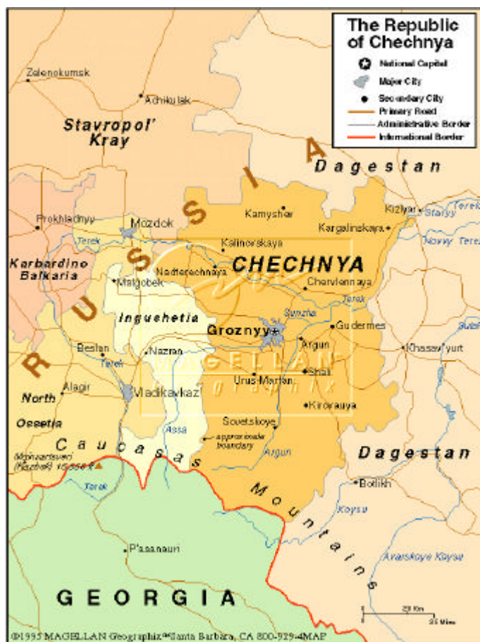
Carte VI : Tchétchénie

Il semble cependant que l'on assiste, pour l'instant, à la résurgence du concept de guerre limitée (ou guerre locale , ou encore petite guerre ) : un concept souvent utile pour justifier une politique d'endiguement, éventuellement liée à une attitude de non-intervention, ou à contrario d'intervention unilatérale sans regard d'un état ou groupe d'état tiers sur la conduite du conflit.