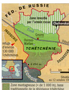
Carte VIII : Situation le 12 octobre 1999