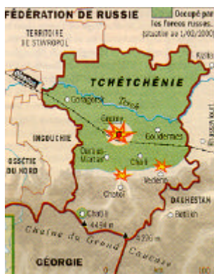
Carte X : Situation le 1 er février 2000