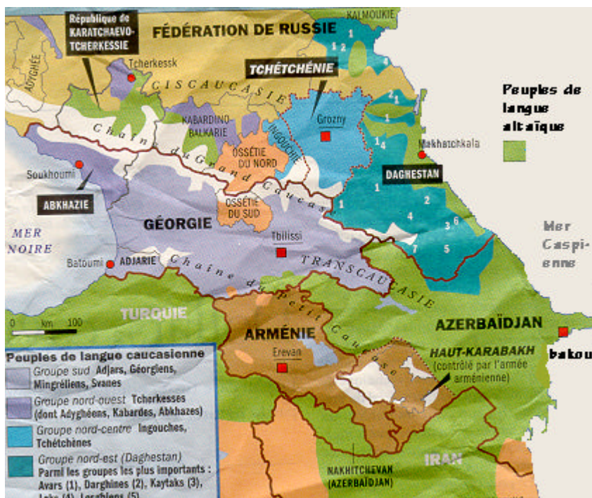
Carte V : La mosaïque caucasienne

La frontière avec la république géorgienne sécessionniste d'Abkhazie accroît le risque d'éclatement de cette région.