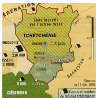
Carte IX : Situation le 14 décembre 1999