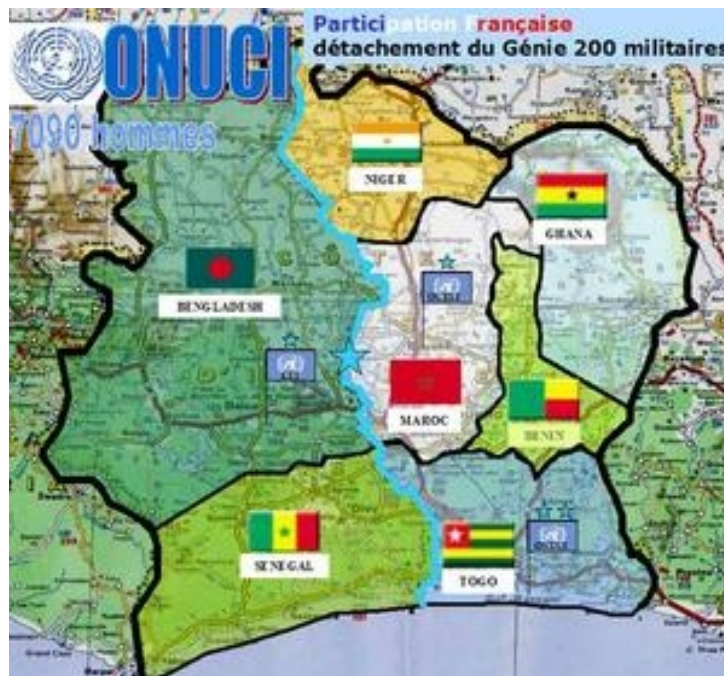
Déploiement des forces de l'ONUCI