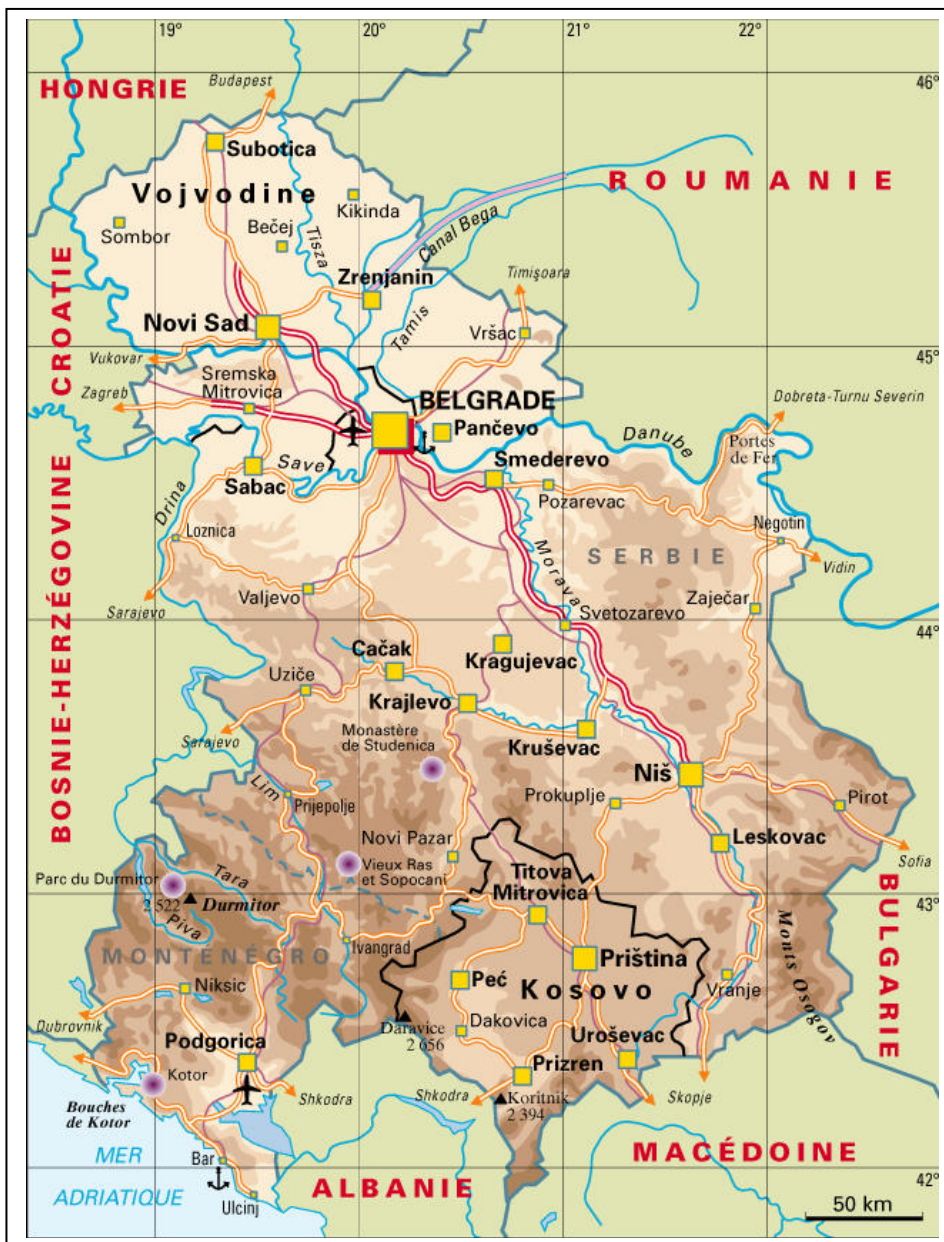
Annexe 1 : Carte de la Serbie-Monténégro