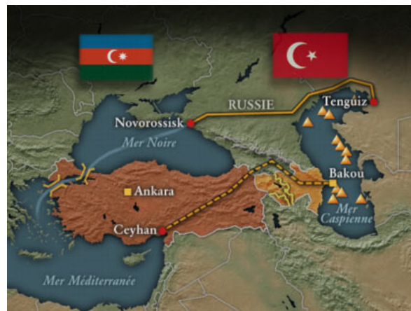
Oléoducs en provenance d'Asie centrale

L'appui de l'allié américain est pour beaucoup dans le choix du trajet turc, mais il n'explique pas tout. Il n'explique pas, par exemple, que les gouvernements centrasiatiques comme celui du Turkménistan aient fait un lobbying acharné pour que leur pétrole soit évacué vers la Turquie plutôt que vers la Russie, la mer Noire ou l'Iran. De fait, même les analyses privilégiant le rôle des États-Unis reconnaissent l'importance centrale de la diplomatie turque et des liens culturels entre Ankara et les pays turcophones.