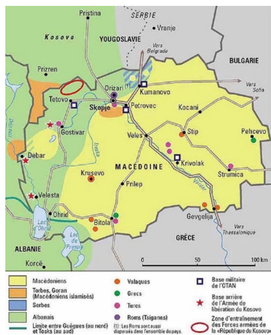
Figure 1: La République de Macédoine physique

La Macédoine est un pays situé en Europe de l'Est au cœur des Balkans, petite république de 2,2 millions d'habitants, est comprise entre le Pinde et l'Olympe au Sud-Ouest, Korab, Mal i Thatë et Jablanica à l'Ouest, la Sar Planina, la Skopska Crna Gora et l'Osogovske Planina au Nord, et le massif des Rhodopes jusqu'au delta du Nestos à l'Est. Son principal débouché maritime est Thessalonique. Ayant toujours occupé une place prédominante dans l'histoire, l'axe Morava-Vardar (jadis emprunté par les Romains, les Francs, les Byzantins, les Serbes, les Ottomans, et les Bulgares puis les Allemands pendant les deux guerres mondiales), constitue un axe de communication commercial essentiel, offrant un débouché sur la mer Égée (Salonique) et permettant un considérable transport fluvial (fleuve Vardar, Axios en Grèce). Sur le plan géostratégique, le territoire de l'actuelle ERYM permet d'atteindre la Serbie, la Bulgarie, la Bosnie-Herzégovine, l'Albanie et la Grèce continentale. Cela explique en grande partie pourquoi les puissances balkaniques ou étrangères se sont toujours disputées sa souveraineté ou son contrôle, voire sa déstabilisation.