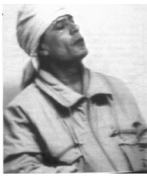
Kachan nomme après l'raid sur Tripoli