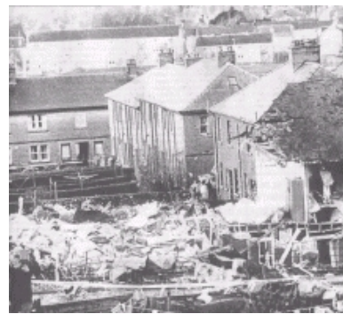
Lockerbe après le raid sur