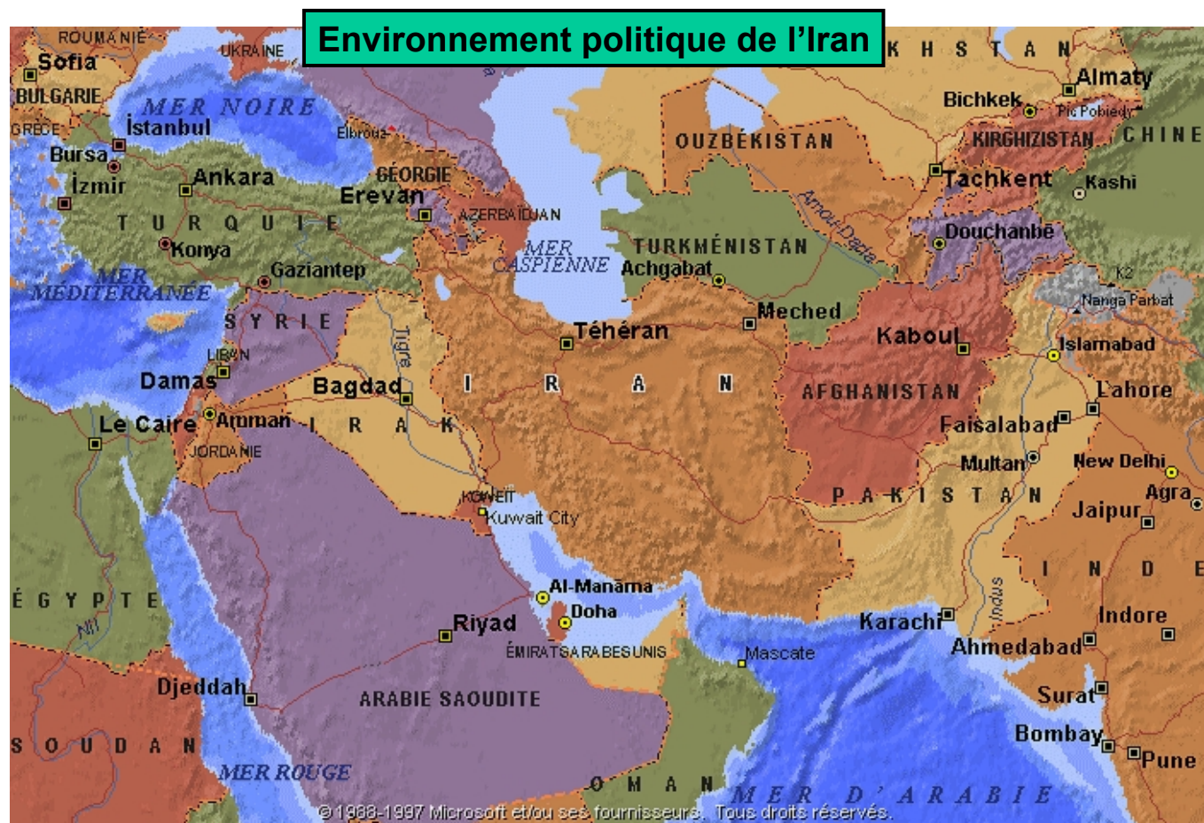
Carte n°1 : Carte régionale du Moyen-Orient.