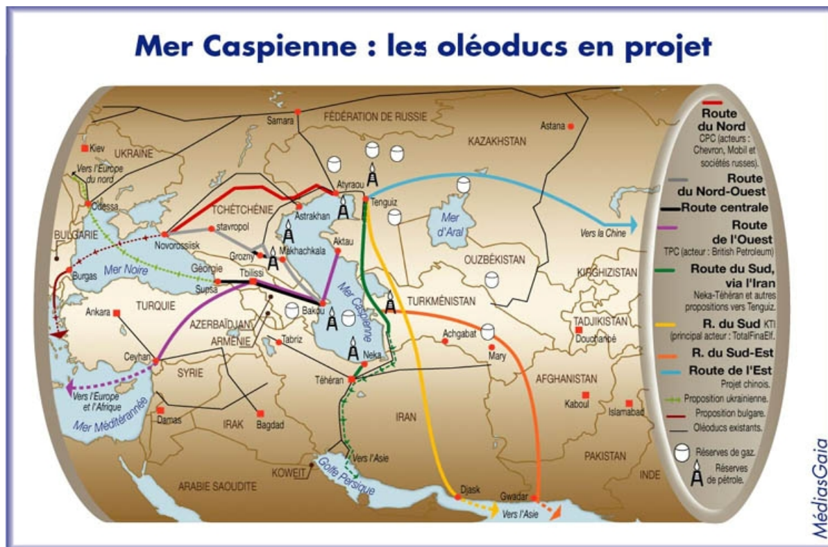
Carte n°5 : Projets d'oléoducs autour de la Caspienne