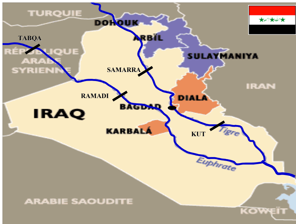
Les barrages des rivières Euphrate et Tigre