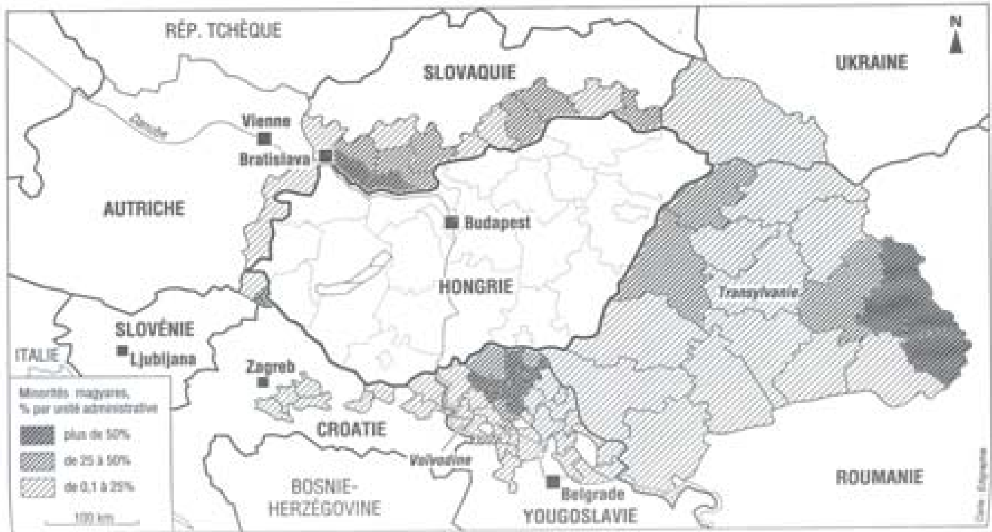
Les minorités hongroises en Europe centrale en 1992