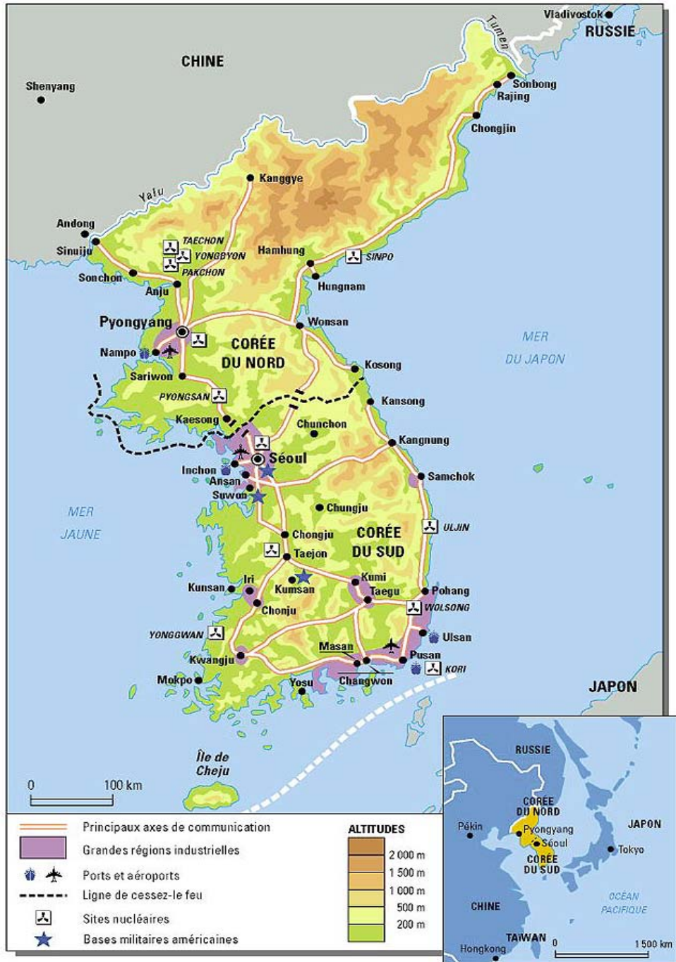
Carte générale de la Corée