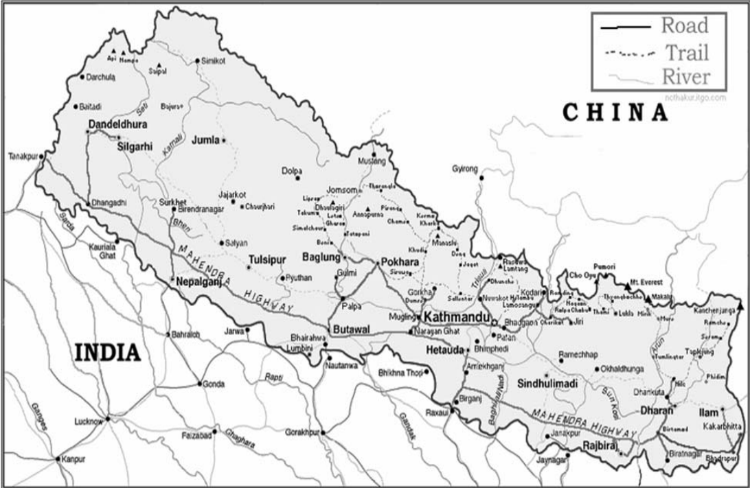
Annexe 1 : cartes du Népal