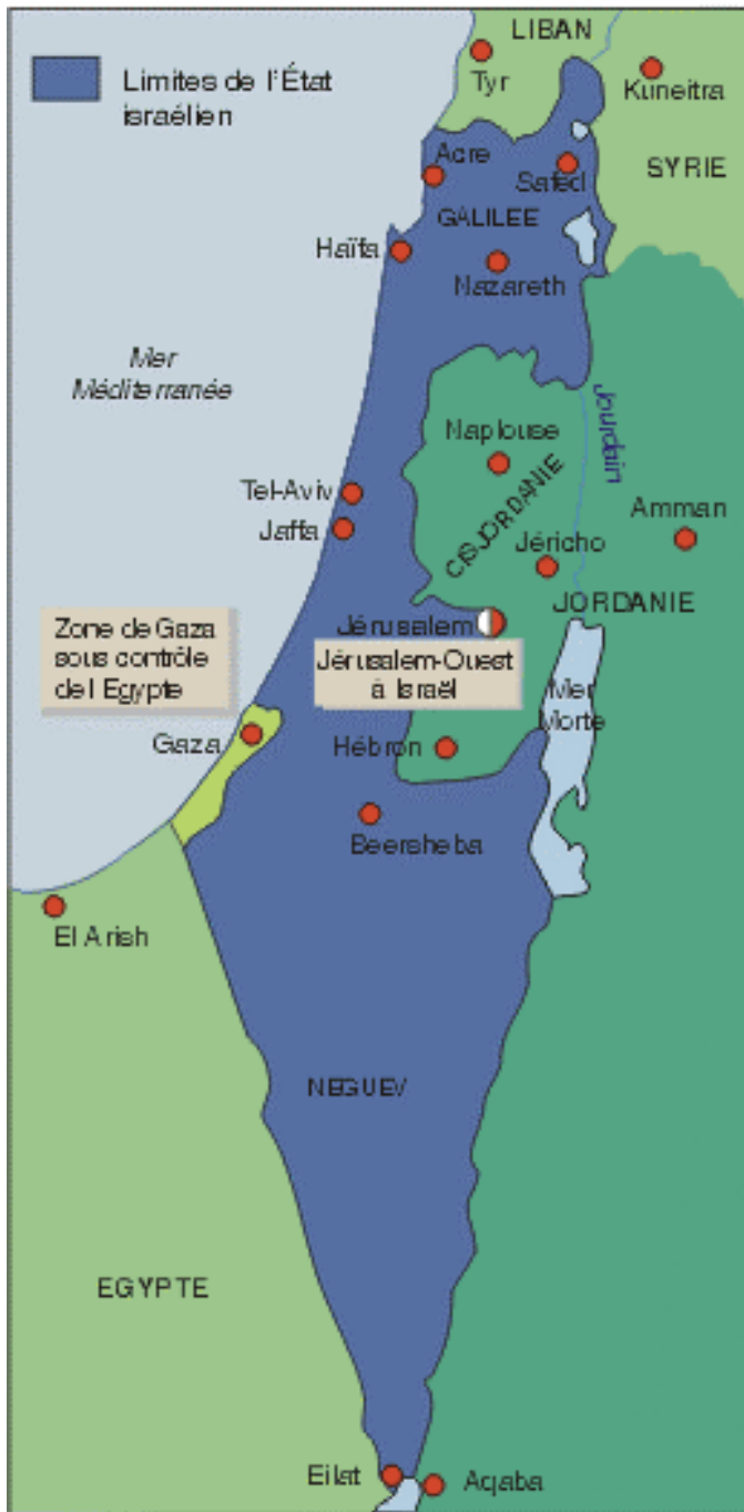
Israël avant 1967