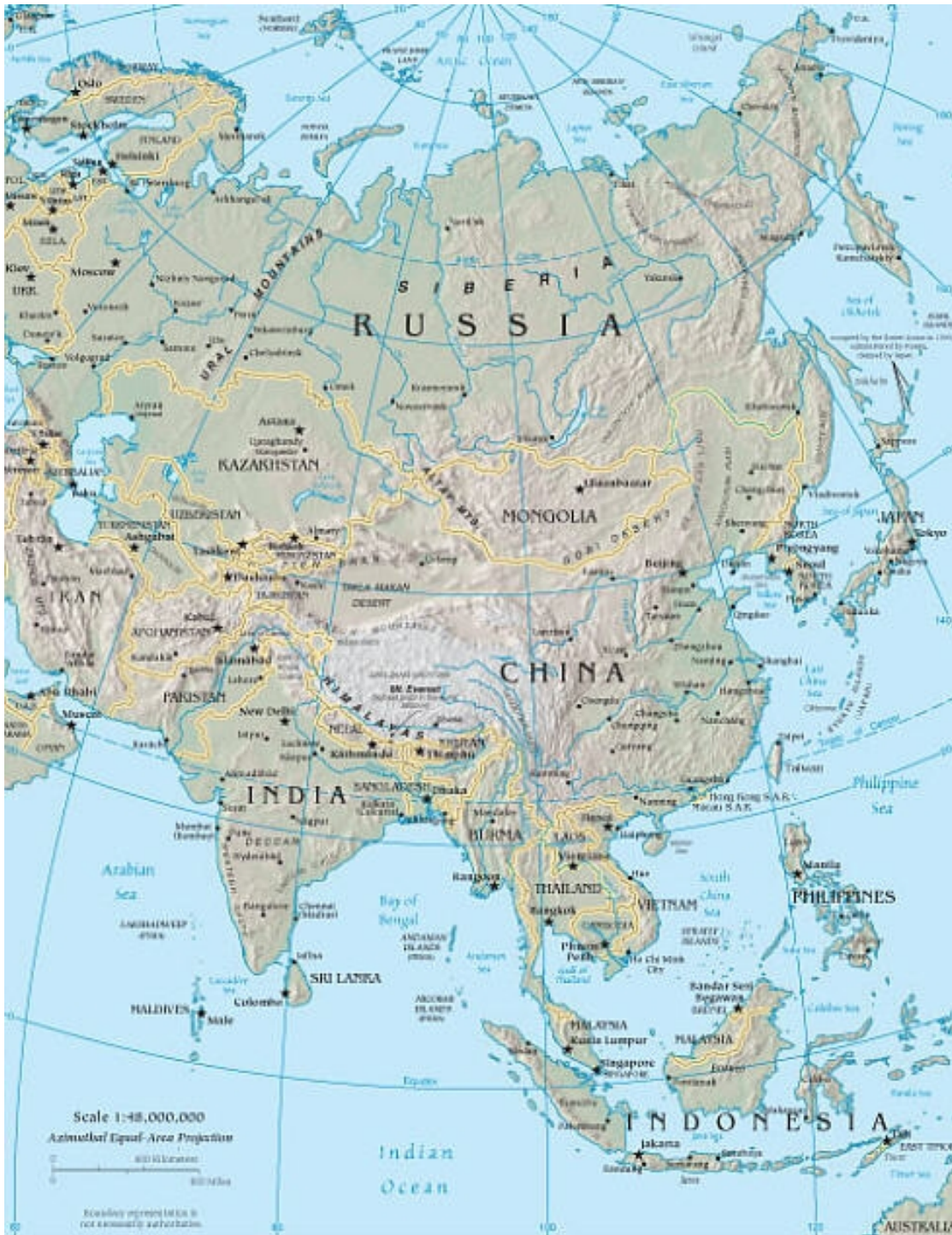
La chine et son environnement