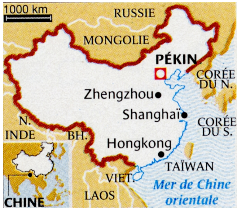
Annexe 2 : carte de la Chine

Pièce(s) jointe(s) à la Fiche de géopolitique du grade nom prénom