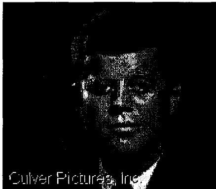
John Fitzgerald Kennedy