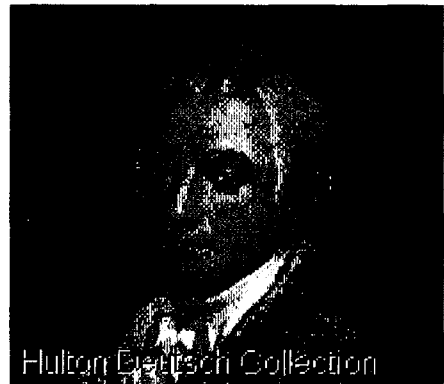
James Monroe