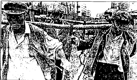
Le principal foyer de contestation ouverte se trouve dans les provinces du Nord-Est, limitrophes de la Sibirie et la Corée.

Les statistiques officielles avouent dix millions d'employés ayant perdu leur travail. Selon d'autres sources, le chômage frappera 20 % des travailleurs des villes industrielles.