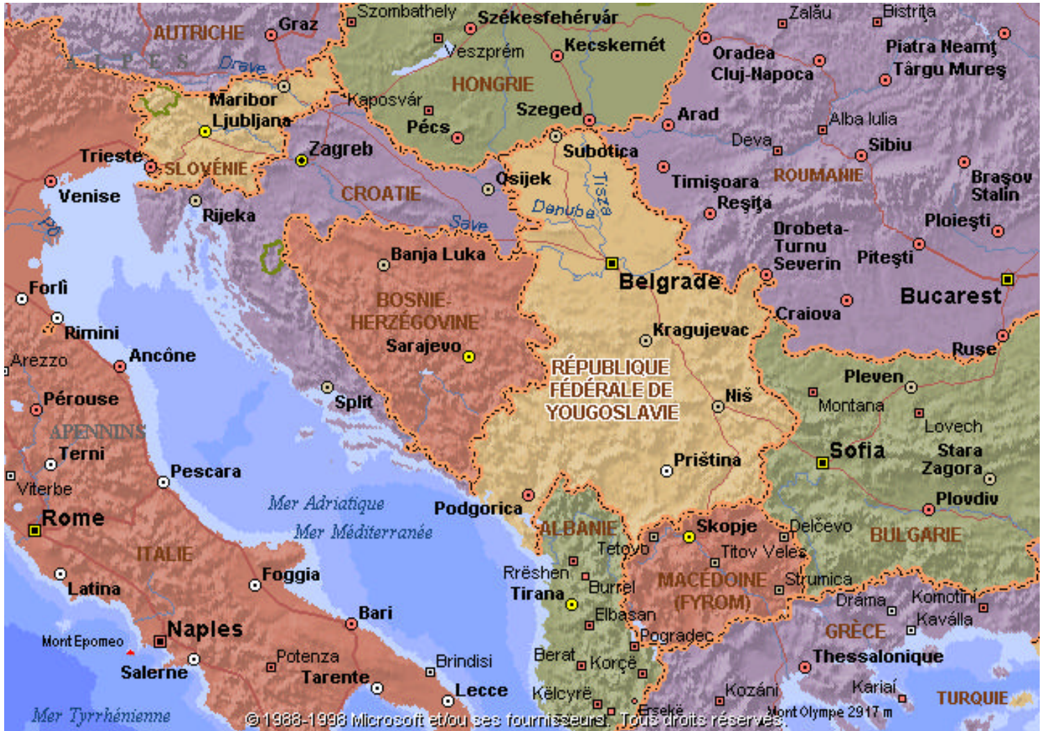
Carte de l'Ex-Yougoslavie (1999)