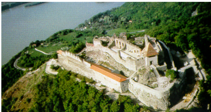
Visegrad, ancien palais royal