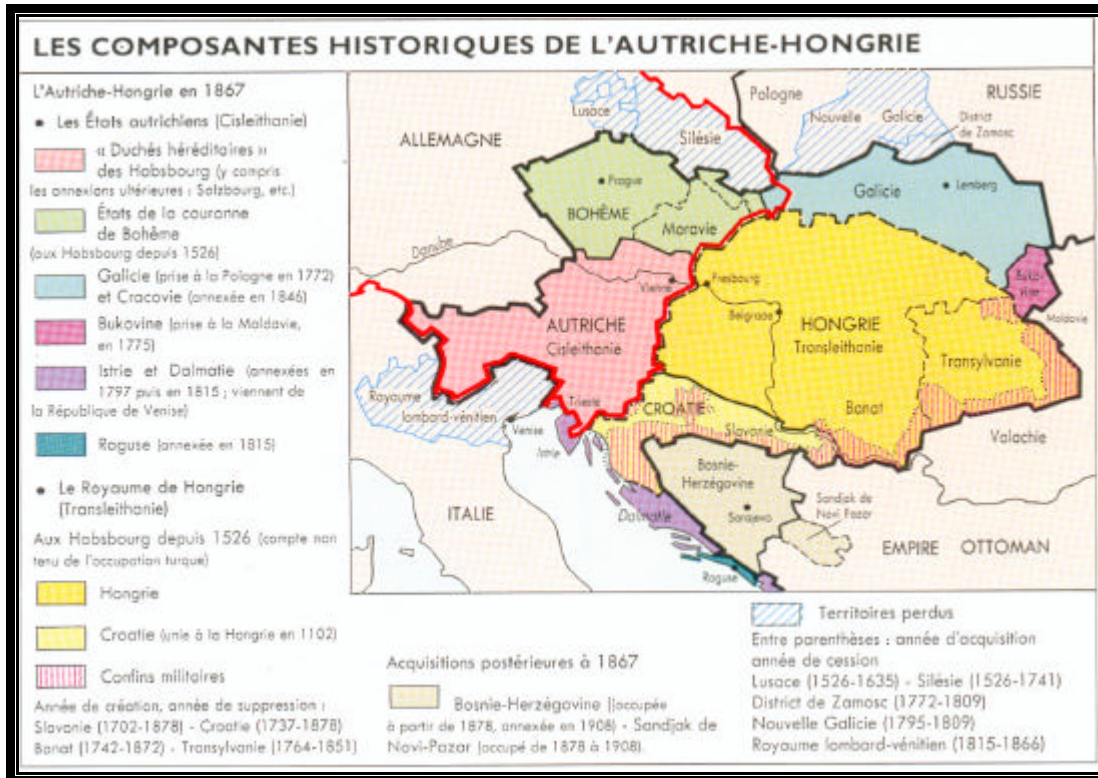
Carte n°3