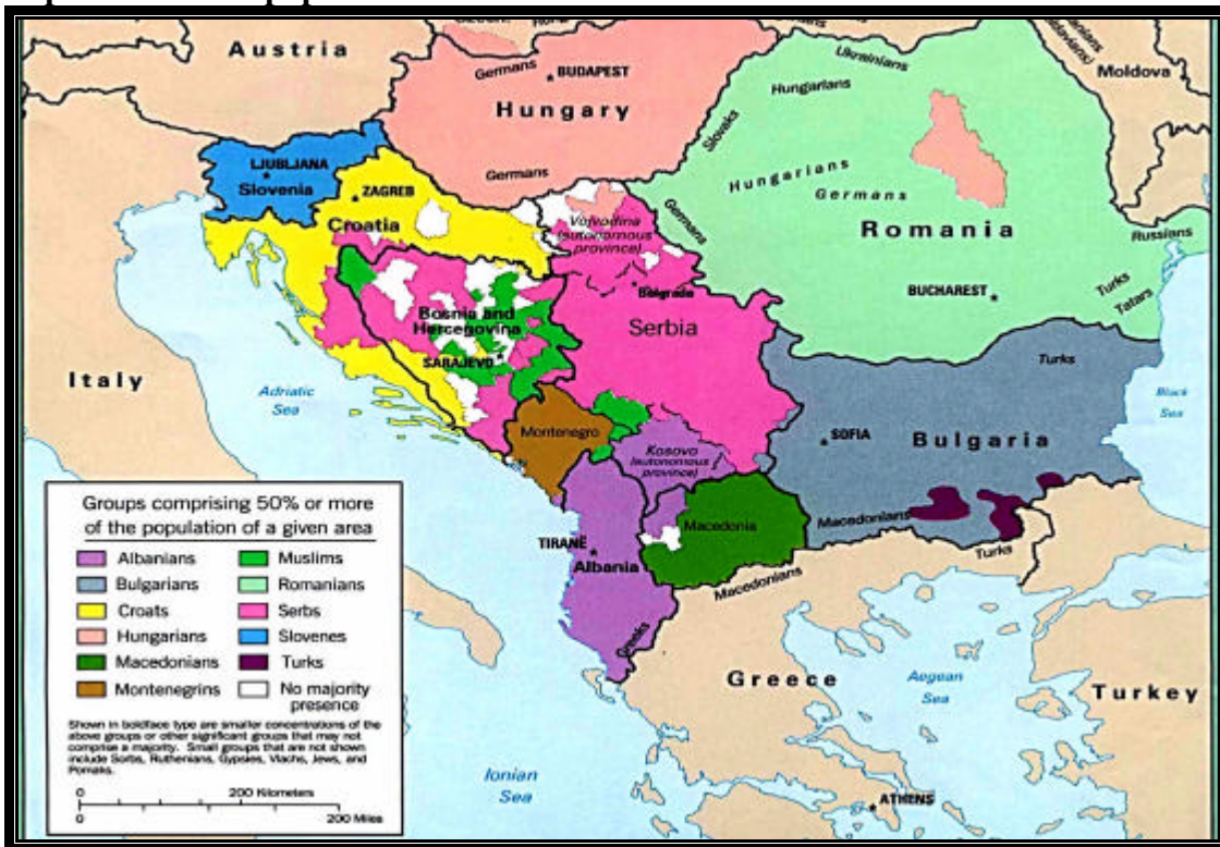
Carte n°5