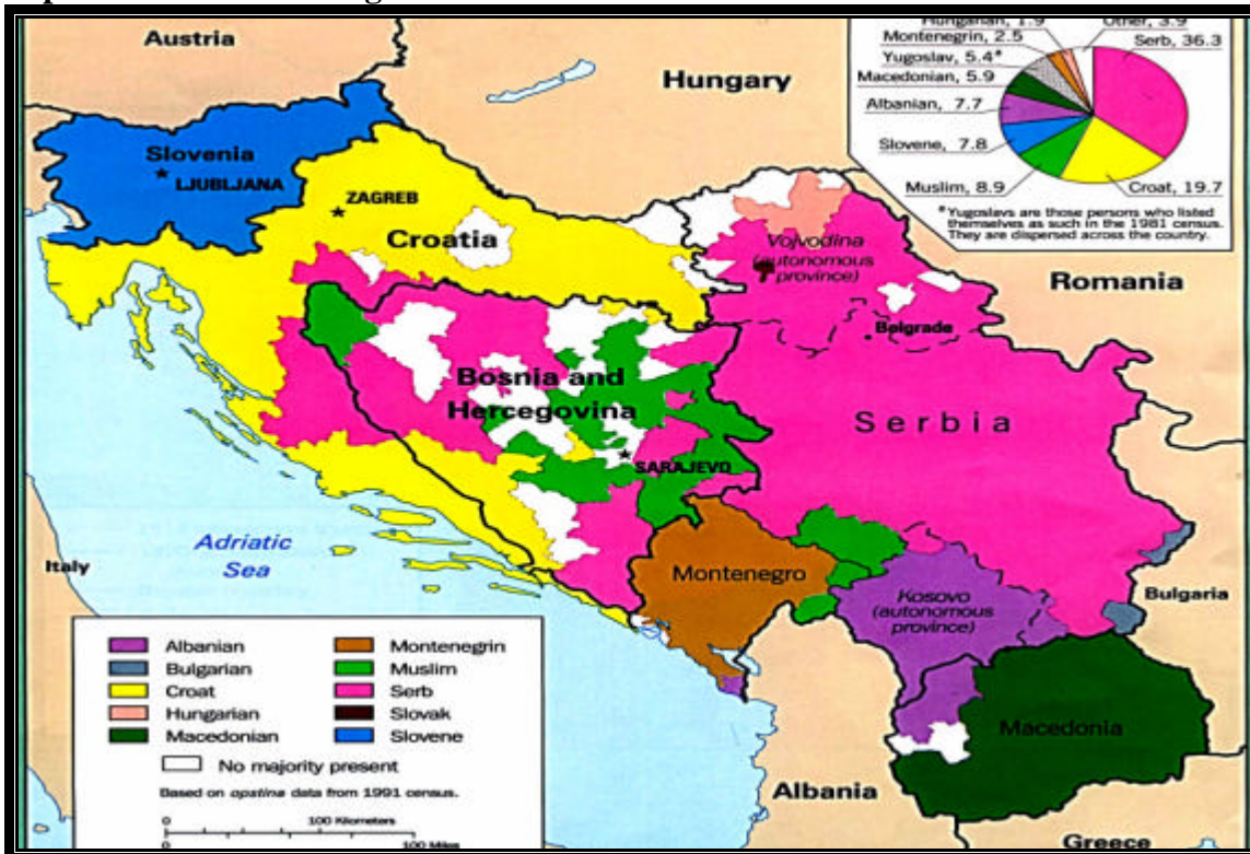
Carte n°6