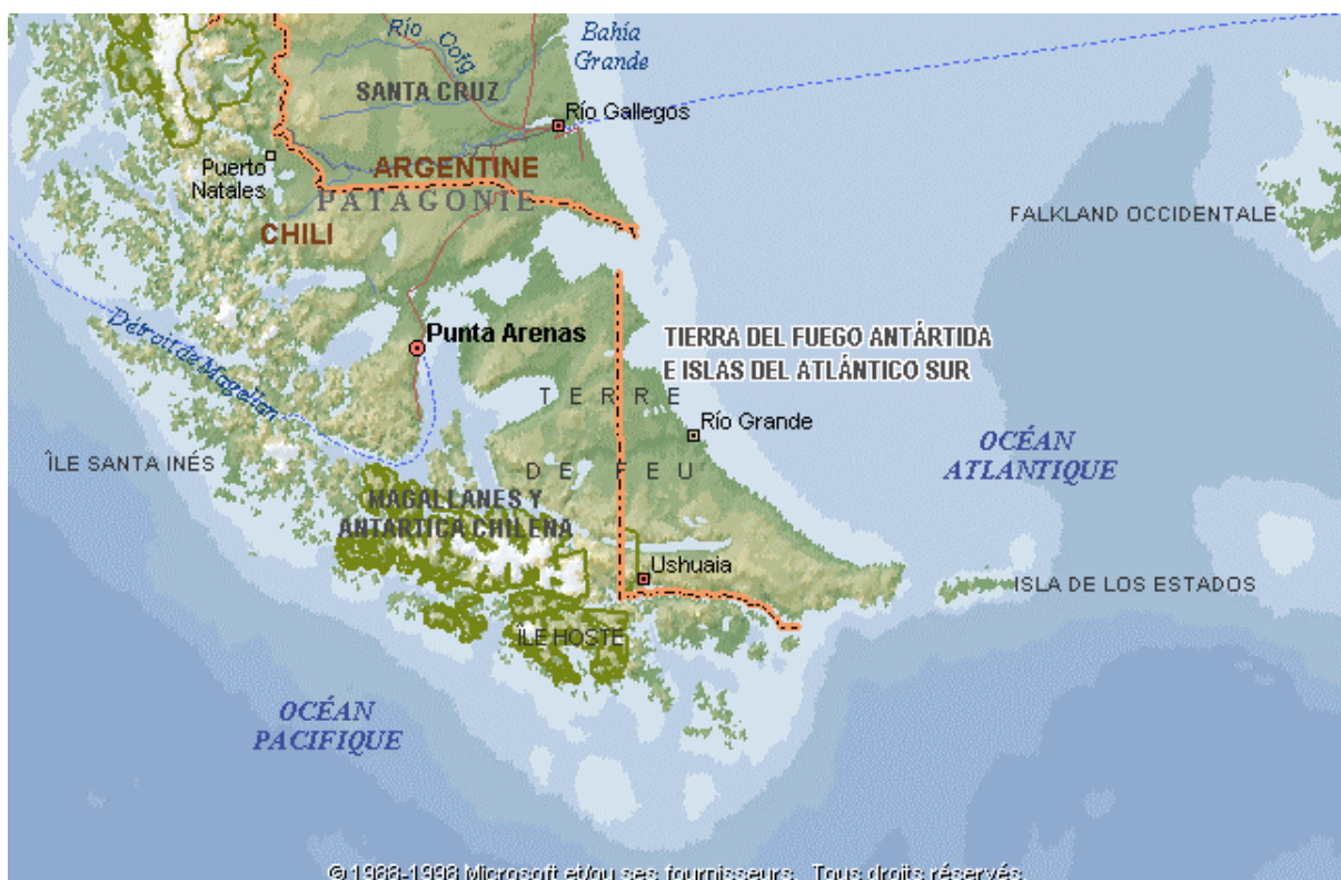
Zone du détroit de Magellan et celle du canal Beagle, avec les limites accordées en 1984.

Malgré ce traité qui était un exemple à l'époque, les différentes interprétations qui ont été faites ont donné plusieurs points problématiques qui n'allaient être totalement résolus qu'en 1999. Le problème le plus grave, celui du Beagle a été la cause d'une crise en 1978 années où les deux pays sont presque arrivés à nouveau à une guerre et est résolue par le traité de Paix et d'Amitié de 1984. Dès cette année là les points de vues nationalistes des deux pays se sont de plus en plus réduits et ont été remplacés par ceux de la coopération et d'intégration.