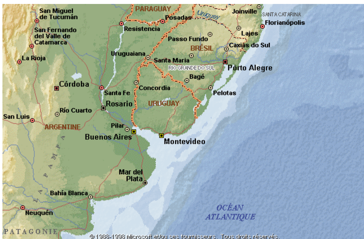
Amérique du sud. Rio de la Plata et sa façade atlantique Positions relatives de Buenos Aires et Montevideo

En réponse, Buenos Aires envoya une armée qui avait pour mission de prendre Montevideo. Le mode d'action choisi était celui de la mise sur siège de la ville, action tout à fait inutile sachant que la ville avait son port pour s'approvisionner. Ce ne fut donc, qu'en 1817 grâce à l'action combinée du siège terrestre et d'un blocus du port, que la ville est tombée sous le contrôle de l'armée de Buenos Aires.