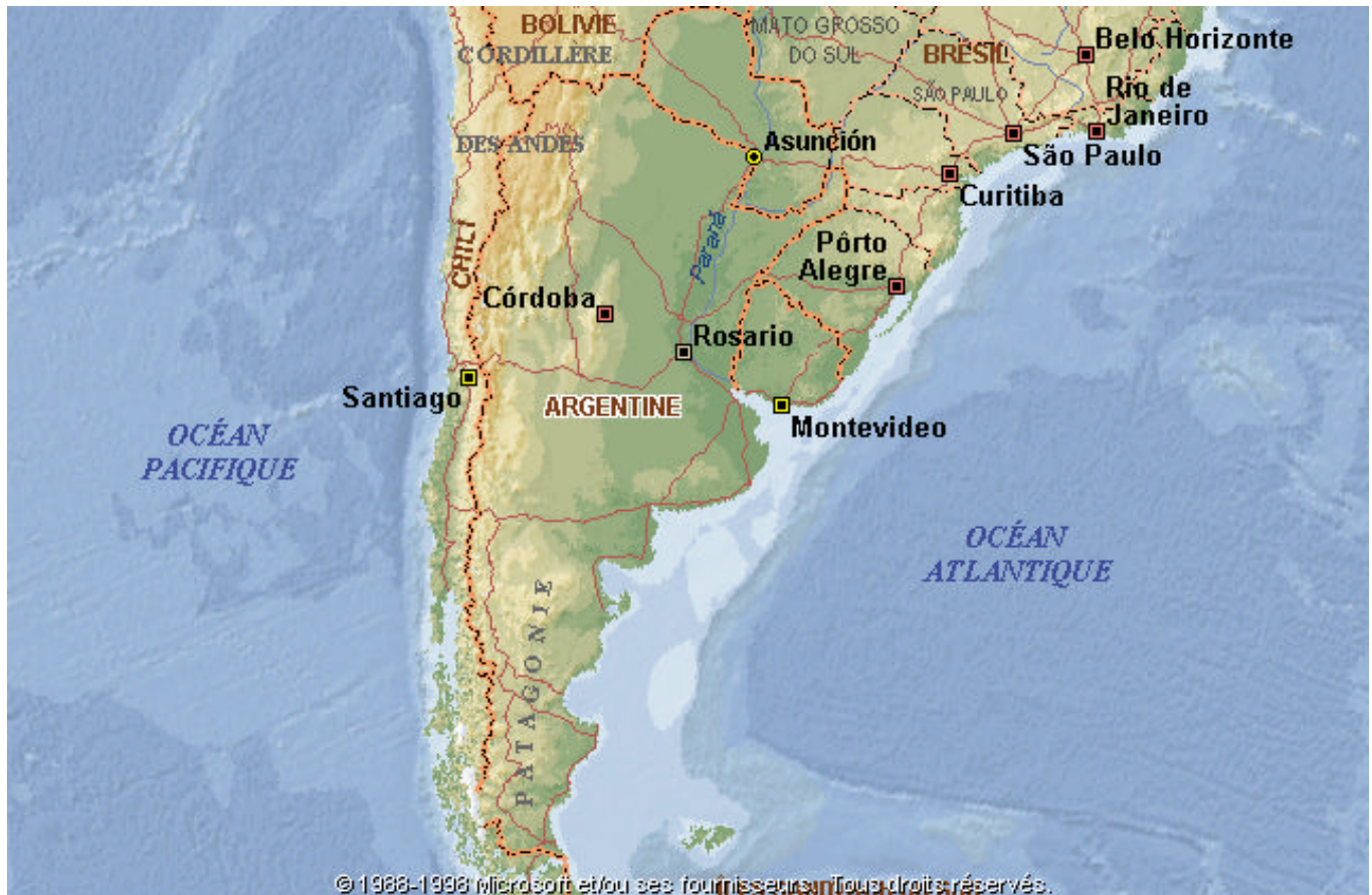
Limites actuelles de la République d'Argentine

l'extrême sud. Cette demande a fini en 1891 avec le traité avec le Chili qui a instauré un précepte dans les relations bilatérales entre les deux pays : « Argentine sur l'Atlantique, Chili sur le Pacifique.