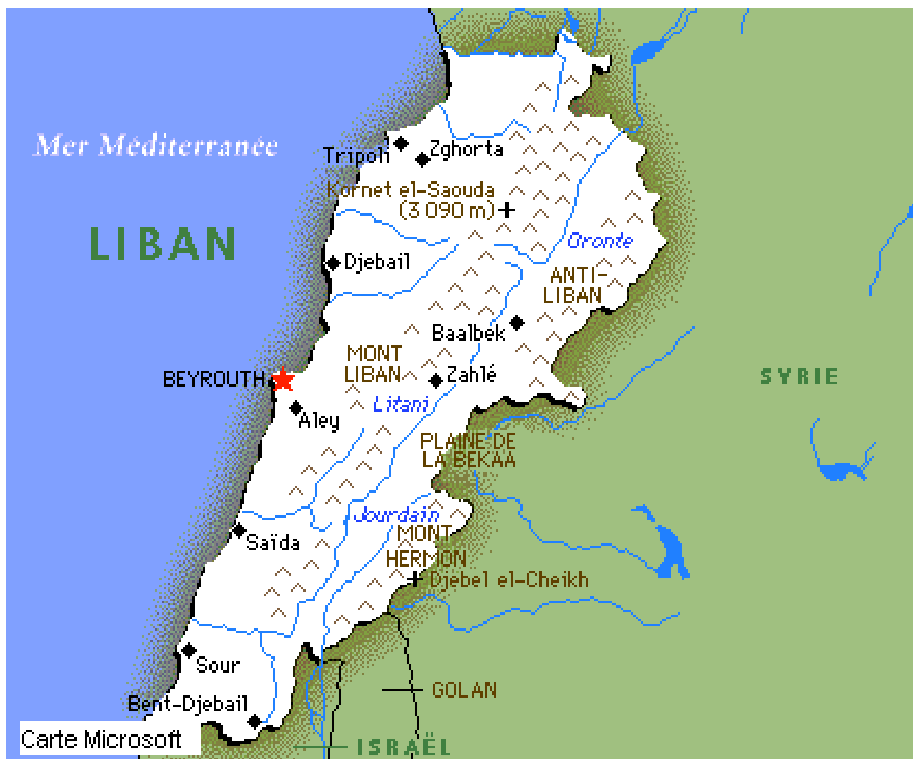
CARTE DU LIBAN