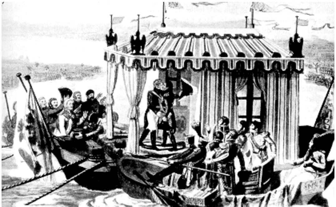
Photo. Le baiser sur le radeau du Niémen, le 25 juin 1807. Hier ennemis, aujourd'hui amis pour le partage du monde!

Napoléon sait tendre la main à son adversaire une fois vaincu en lui proposant une réconciliation. Il a montré ainsi son talent de stratège: un esprit large associé à une forte détermination, en quête d'initiative. Bonaparte prend des risques et en tire bénéfice. La Paix de Tilsit est signée le 25 juillet 1807. Les ennemis d'hier ont non seulement fait cesser la guerre, mais sont devenus des alliés. A Sainte-Hélène Napoléon avoue que le plus grand jour de sa vie fut " Tilsit ".