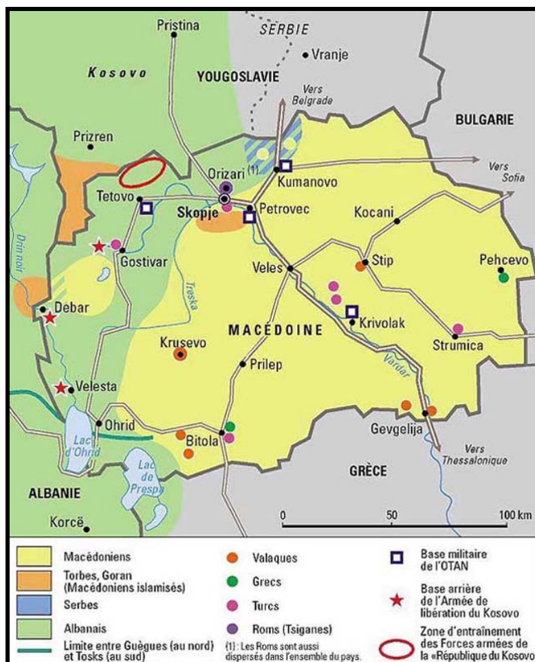
Figure 2 : La population macédonienne

Actuellement, les Slavo-Macédoniens représentent moins de 67% de la population macédonienne 3 .