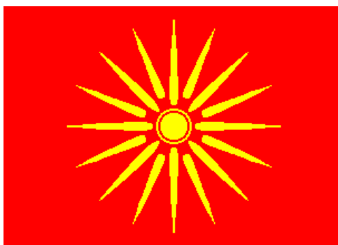
Figure 5 : Le Soleil de Vergina, emblème national macédonien avant 1995

Toutefois, les observateurs rapportent que Milosevic a été indigné par cette sécession : il avait semble-t-il prévu de créer une « fédération orthodoxe » regroupant la Serbie, le Monténégro et la Macédoine. Il a accusé la Macédoine de le « poignarder dans le dos », mais, déjà engagé dans des guerres en Croatie et en Bosnie, l'ancien président yougoslave ne pouvait guère s'opposer militairement au projet macédonien. Les combats prolongés ont ensuite empêché Milosevic d'ouvrir un « front méridional ». Bien que Belgrade ait reconnu la Macédoine en 1996, le gouvernement de Milosevic a constamment cherché à ébranler Skopje en encourageant les extrémistes serbes. Belgrade a prétendu que la Macédoine abritait une minorité serbe en danger de 350 000 personnes, alors que seules 55 000 personnes se sont déclarées serbes lors du dernier recensement de 1994. En 1995 le président Gligorov s'était rendu à Belgrade pour s'entendre dire que le gouvernement yougoslave accepterait la frontière administrative. Cependant, il a fallu attendre le 22 février 2001 pour qu'un accord soit finalement signé, profitant certainement des changements politiques survenus en République Fédérale Yougoslave à la fin de l'année 2000.