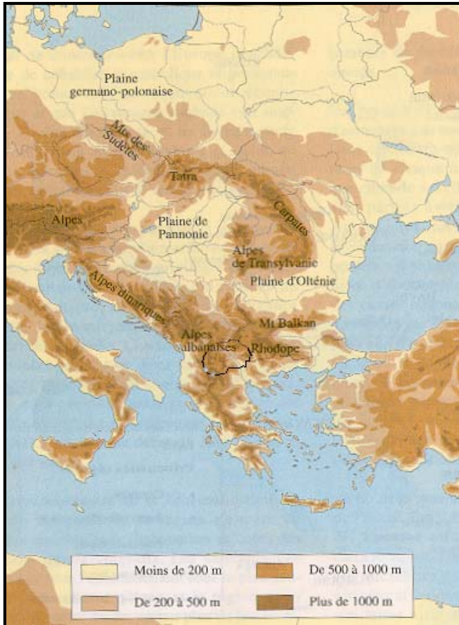
Figure 1 : Carte générale du relief de Balkans

même, le nom « Macédonien » sera appliqué aux citoyens de cette république, sans distinction ethnique, religieuse ou nationale. Chaque fois qu'une distinction sera indispensable pour la compréhension du texte, une composition telle que « slavo-macédonien » sera utilisée.