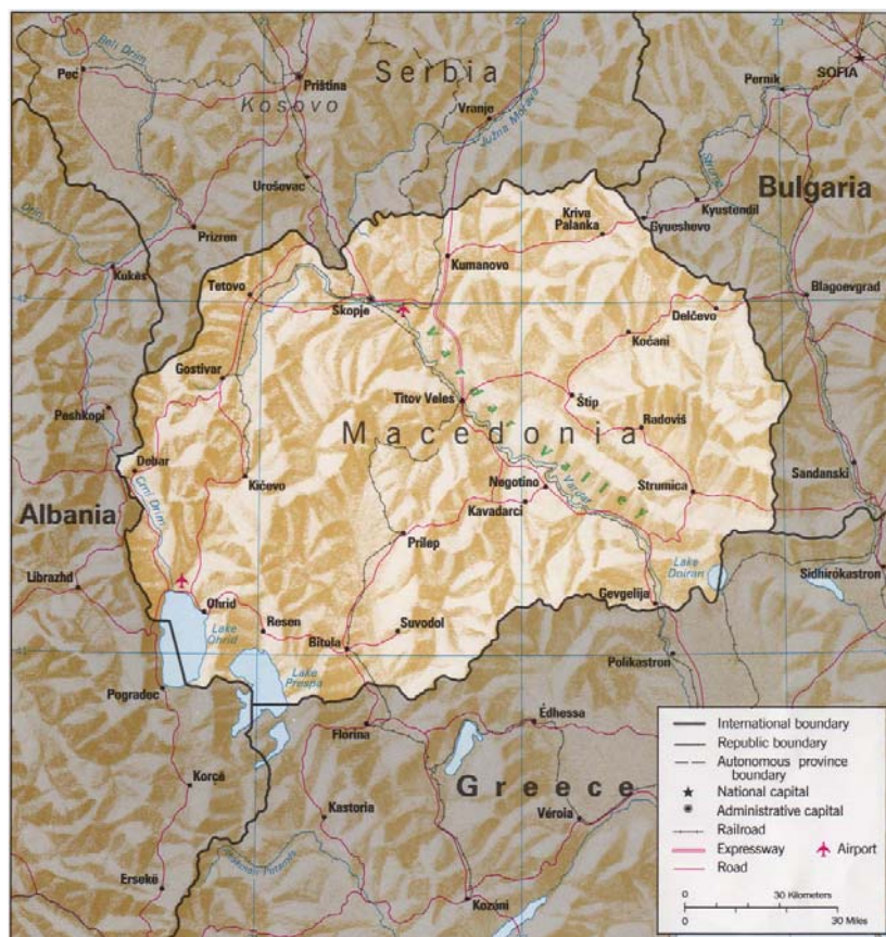
Figure 7: La République de Macédoine physique

La Macédoine peut donc apparaître comme un pays totalement enclavé et hermétique. Toutefois la République dispose d'un atout majeur dans la région, dans la mesure où elle est coupée en deux par la vallée du Vardar ; cet axe de pénétration dans le sud des Balkans est une voie de communication majeure de la mer Egée et de l'Europe du sud vers l'Europe centrale et l'Europe de l'ouest. Il est matérialisé par la route qui relie Thessalonique à Belgrade, et qui apparaît sur l'ensemble des cartes de la région.