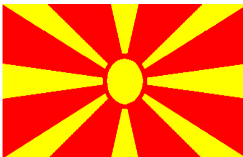
Figure 6 : Drapeau de la République de Macédoine depuis 1995