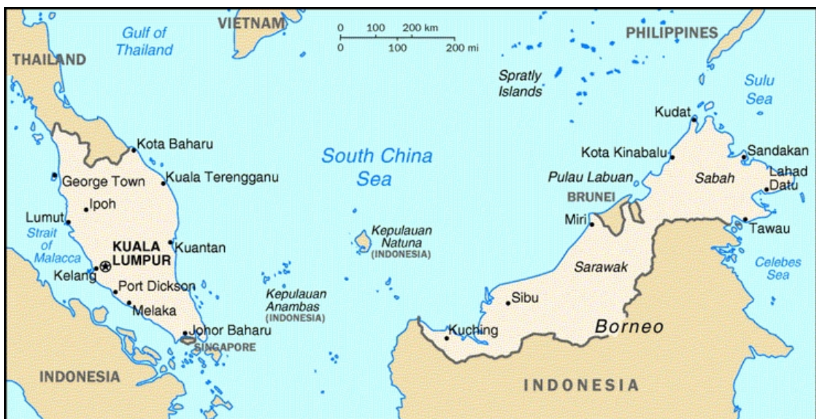
Carte 2 : Malaisie

En Malaisie, l'ethnie principale était l'ethnie malaise. Cependant, les immigrants chinois arrivés depuis le 19 ème siècle, représentent aujourd'hui un tiers de la population malaise, et ils ont une situation économique très confortable. Les Malais revendiquant la propriété de leur territoire, supportaient mal la domination de leur système économique par les Chinois. D'autre part, les Malais d'origine chinoise se sentant menacés, demandèrent l'équité politique. Depuis l'indépendance de la Malaisie, la nouvelle tâche de celle-ci est de développer l'économie. Pour ce faire, il ne s'agit pas de se fonder sur un système politique existant, mais sur la volonté de ses peuples. Si on forme une identité nationale qui prend en compte les valeurs traditionnelles de chaque ethnie, des confrontations et des frictions entre les différentes communautés à l'intérieur de ce pays