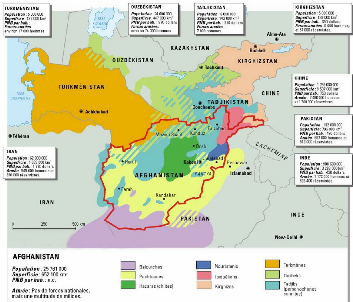
Carte 4 : les forces en présence