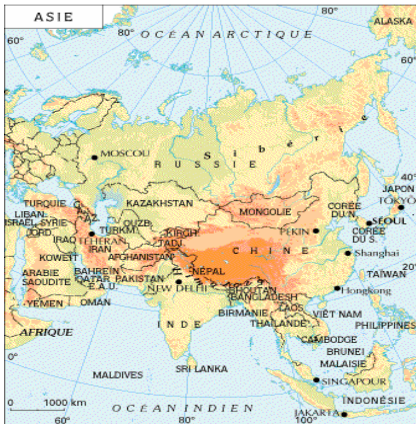
Carte 1 : L'Asie Centrale