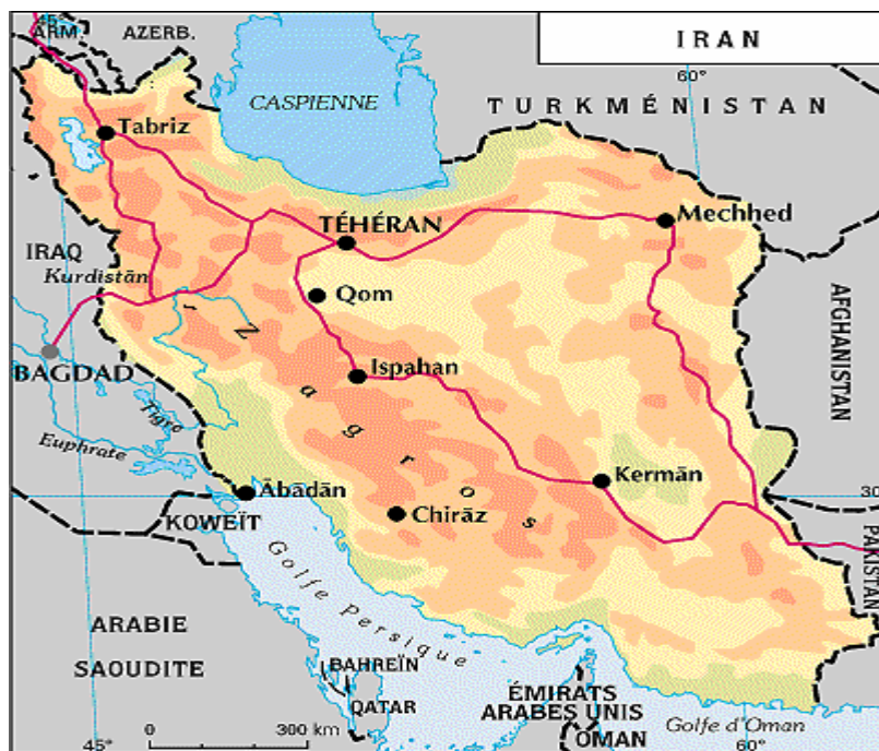
Carte 2 : Les hauts plateaux iraniens