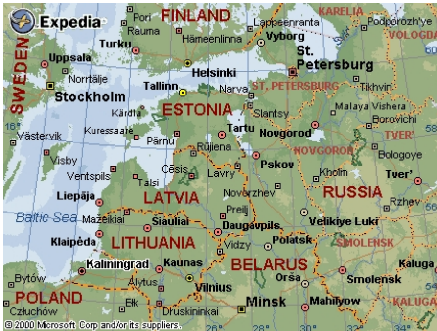
Figure 4 : l'environnement des Etats baltes