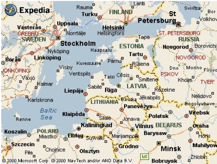
Figure 1 : les Etats baltes.

L’Estonie, la Lettonie et la Lituanie sont couramment regroupées sous le terme générique d’Etats baltes, en raison d’une situation géographique et d’une histoire tourmentée, résolument associées aux rivages de la mer Baltique. Au Moyen Age, toute la région (la Hanse) connaît une expansion commerciale qui attise la convoitise de puissants voisins. Ceux-ci la domineront à tour de rôle, habitude qui s’est perpétuée jusqu’à une période récente. Ce passé a profondément marqué ces trois Etats, qui perçoivent de manière aiguë la nécessité d’une politique de défense rationnelle, pour espérer sauvegarder l’indépendance ainsi retrouvée.