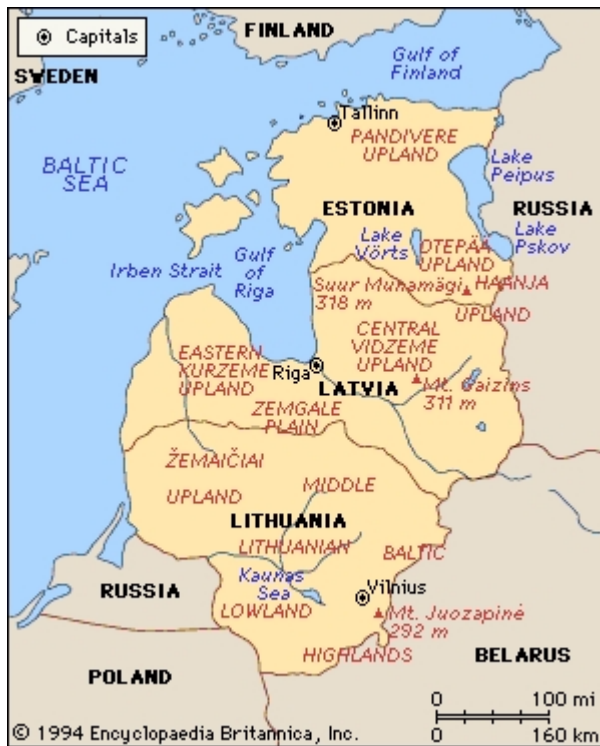
Figure 2 : le découpage régional des pays baltes.

Le différend frontalier a été moins pesant pour la Lettonie, qui a pu mener ces négociations avec plus de sérénité. La zone concernée était plus restreinte et les ajustements requis plus modestes. Pour que l'origine de la demande soit explicite, la Lettonie a toutefois exigé que le traité de 1920 (en l'occurrence, le traité de Riga) soit mentionné dans le préambule. Dès qu'elle a renoncé à cette exigence, l'accord a été prêt dans le moindre détail. A l'heure ce document n'est toujours pas signé, et les relations diplomatiques se sont entre-temps nettement détériorées.