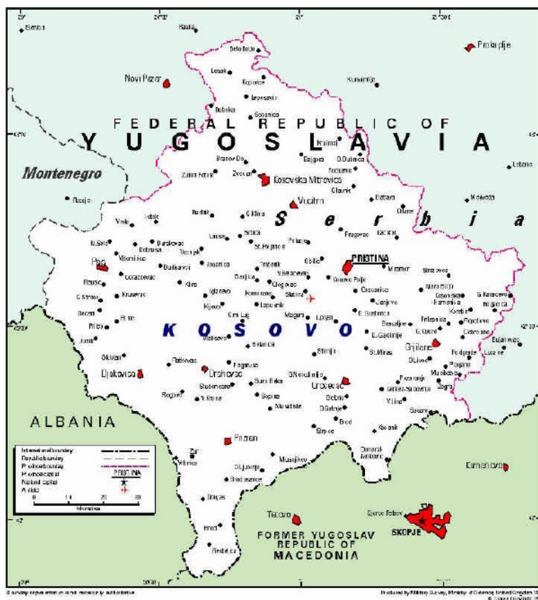
Le Kosovo ( extrait de « Encyclopédie Hachette 2000 » )

Outre l'argent, l'or et le cuivre, « la province autonome du Kosovo seule dispose de la moitié des réserves de plomb, de zinc et de lignite de la Yougoslavie, ce dernier représentant 27% des réserves d'énergie primaire du pays » 8 . Grâce à cette richesse minière, le Kosovo a été spécialisé dans la production primaire. Il approvisionne les républiques du nord en produits bruts et offre des débouchés protégés pour leurs produits finis, dans le cadre de la division de travail au sein de la Yougoslavie titiste. Seulement, avec un revenu par habitant six fois moins élevé qu'en Slovénie en 1990, le Kosovo reste la province la plus pauvre de la République yougoslave. Malgré la nouvelle constitution de 1974 qui lui a permis de prendre en main son destin, du moins jusqu'en 1990, et les aides du gouvernement fédéral yougoslave, ce territoire n'a pas réussi son décollage économique. En fait ceci s'est tout simplement bloqué à la mort de Tito, quand la deuxième crise énergétique mondiale a frappé, de manière tardive, l'économie de la République en 1980. L'arrivée de Slobodan Milosevic, avec sa politique d'exclusion systématique des Albanais de toutes les institutions, le transfert d'une partie des usines du Kosovo en Serbie et la guerre n'ont fait que porter le coup de grâce à cette économie déjà chancelante. David Blanchon y trouvait un grand nombre de traits socioéconomiques caractéristiques des régions en difficulté du sud du bassin méditerranéen 9 .