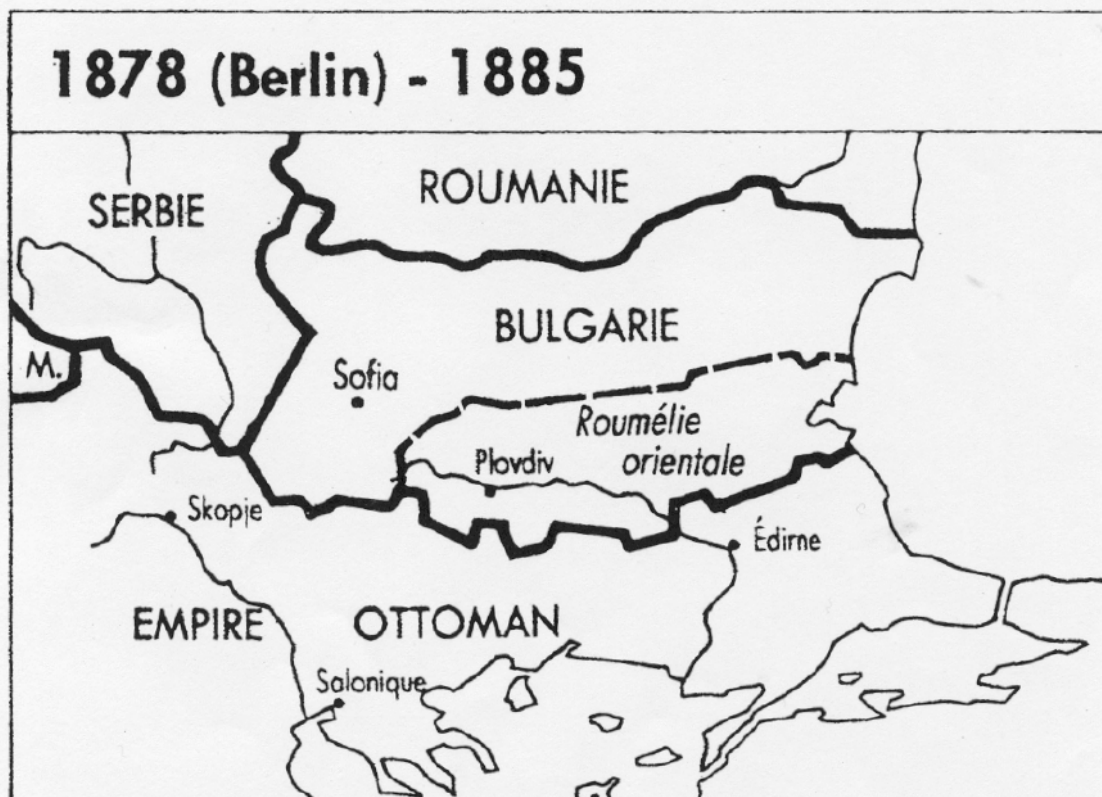
Les frontières de la Bulgarie à San Stéfano puis à Berlin.