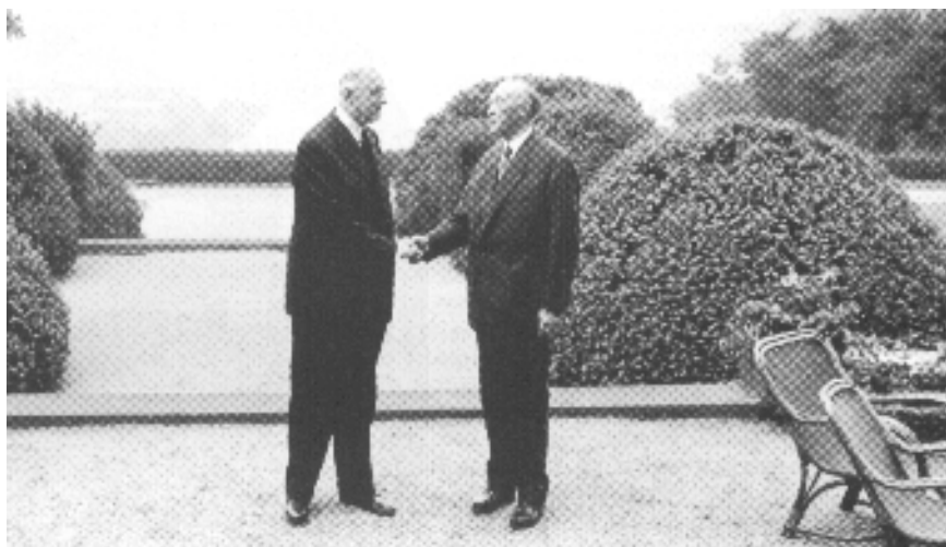
22 février 1963 : Traité de l'Élysée d'amitié franco-allemande

Ce fut un véritable événement historique quand, en 1963 par le Traité de l'Élysée, Charles de Gaulle et Konrad Adenauer portèrent à un niveau tout à fait nouveau les relations entre Français et Allemands. Ils conclurent le traité d'amitié franco-allemande et se promirent de mieux travailler ensemble au niveau de la défense. Bien que le Traité ait constitué une bonne base pour de futures coopérations, rien de très important ne fut fait dans les vingt ans suivant sa conclusion. Certes, quelques grands programmes d'armement ont pu être réalisés ensemble - l'avion de transport "Transall", l'Alpha Jet et des armes de défense antiaérienne et de combat antichars-. Toutefois, il a fallu attendre que François Mitterrand et Helmut Kohl aient été élus dans leurs pays respectifs pour qu'une forme concrète - voire une structure - soit donnée à la coopération militaire. Les deux hommes politiques ont ainsi poursuivi l'oeuvre commencée par Valéry Giscard d'Estaing et Helmut Schmidt.