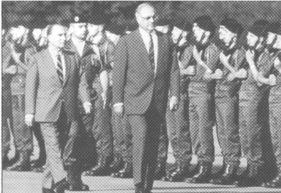
14 octobre 1996 : Création de la Brigade Franco-Allemande

Ils furent suivi par la mise sur pied de la Brigade Franco-Allemande. Aujourd'hui, cette grande unité binationale est devenue non seulement une réalité historique mais aussi l'emblème même de cette coopération franco-allemande.