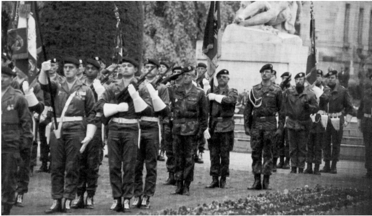
05 novembre 1993 : Cérémonie d'intronisation du Corps Européen

Agissant ainsi, ils portèrent la coopération militaire franco-allemande à un niveau élevé au sein de l'ensemble européen, niveau auquel ces deux hommes politiques avaient toujours aspiré.