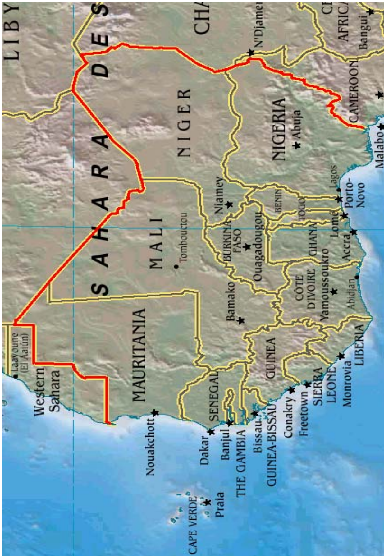
L'AFRIQUE DE L'OUEST