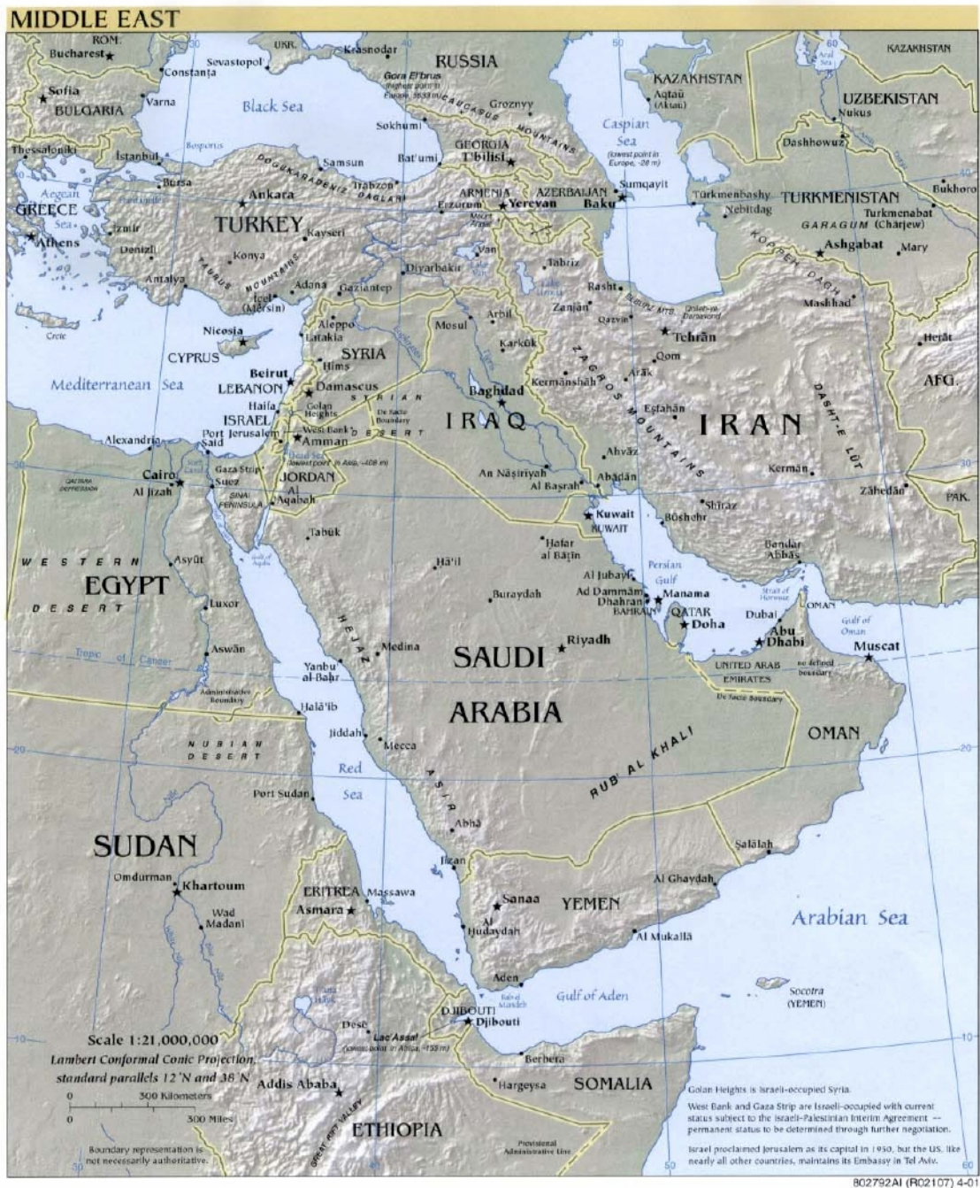
ANNEXE 3 : Moyen orient en 2002