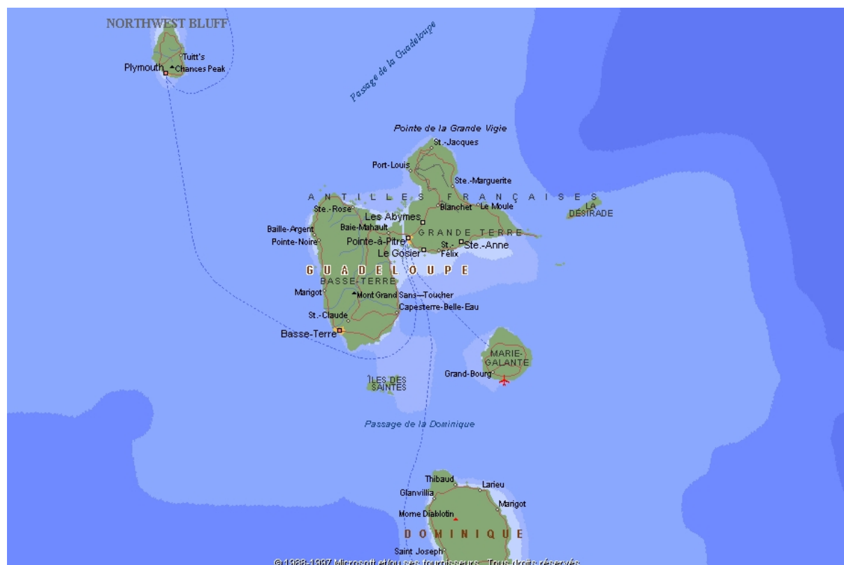
Figure 1 : la guadeloupe dans l'arc antillais

L'Etat est représenté par le préfet établi à Basse-Terre et 2 sous-préfets à Pointe-à-Pitre et à Saint-Martin. En tant que département français d'outre-mer, la Guadeloupe fait partie de l'Union européenne au sein de laquelle elle constitue une région ultra-périphérique ; à ce titre, elle bénéficie de « mesures spécifiques » qui adaptent le droit communautaire en tenant compte des caractéristiques et contraintes particulières de ces régions.