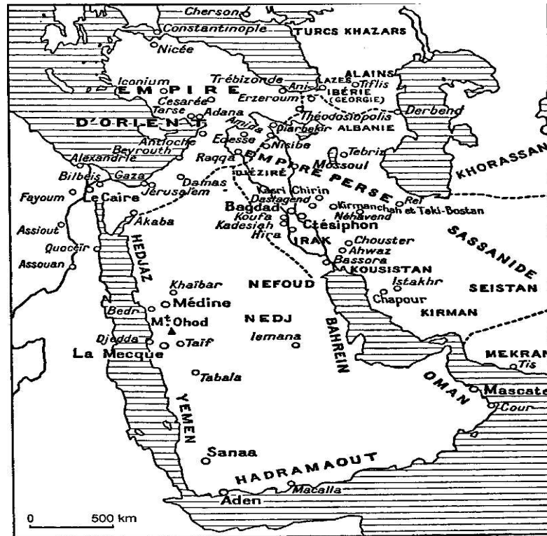
Le Moyen-Orient à la veille de l'Islam