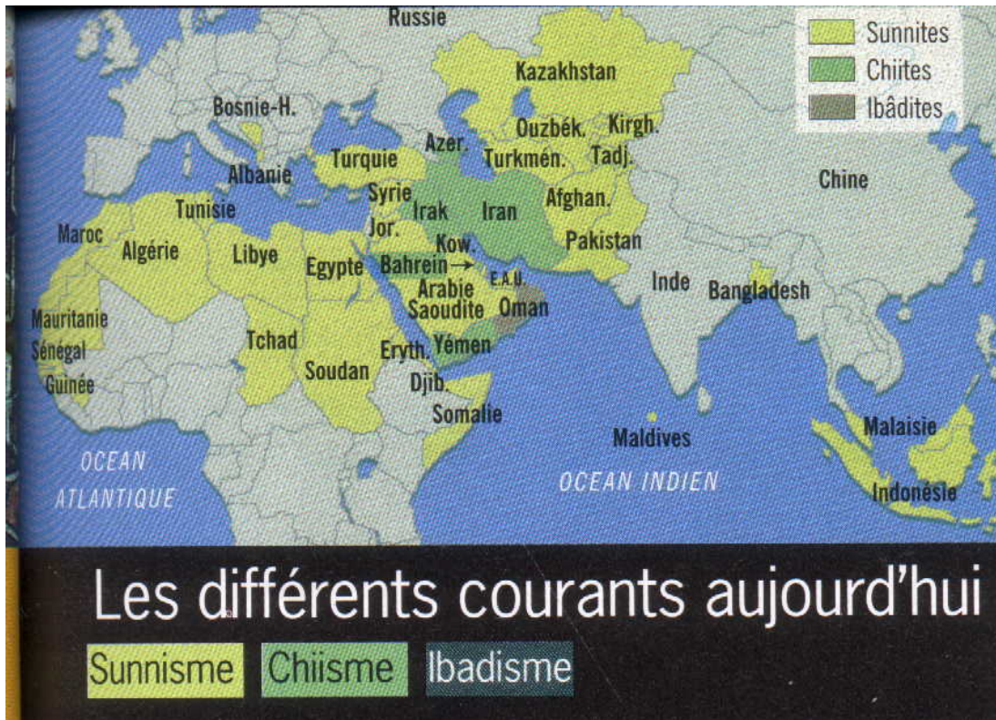
Carte 3 : DIFFERENTS COURANTS DE PENSEE DE L'ISLAM