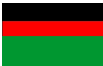
Avr 1978 – oct 1978