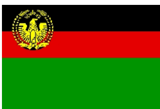
Mai 1974 – avr 1978