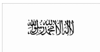
Drapeau taliban 25 oct 1997 – 13 nov 2001