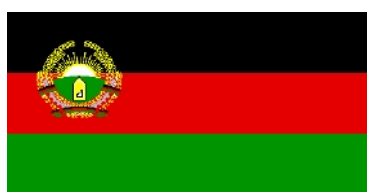
Nov 1987 – avr 1992