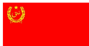
Oct 1978 – avr 1980