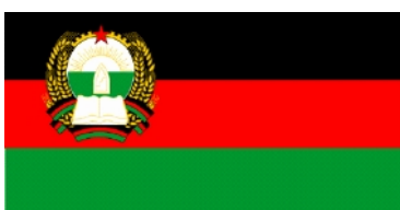
Avr 1980 – nov 1987