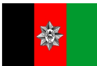
Oct 1929 – 1930