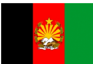
Sep 1928 – Jan 1929