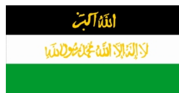
Avr 1992– déc 1992