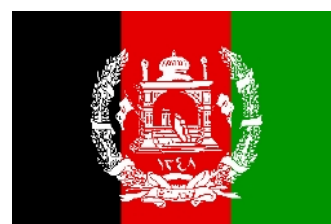
1930 – mai 1974