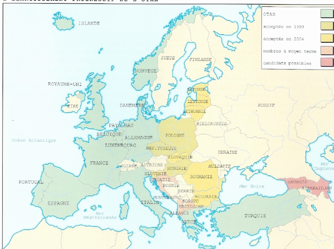
L'ÉLARGISSEMENT PROGRESSIF DE L'OTAN

Source : « Atlas du nouvel ordre mondial », Gérard Chaliand, éditions Robert Laffont