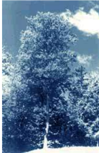
Le bouleau jaune