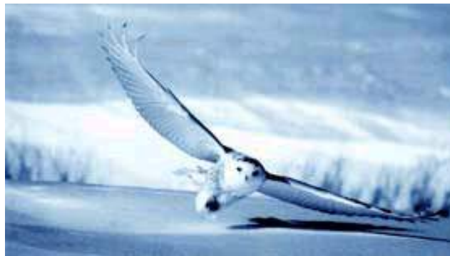
Le harfang des neiges