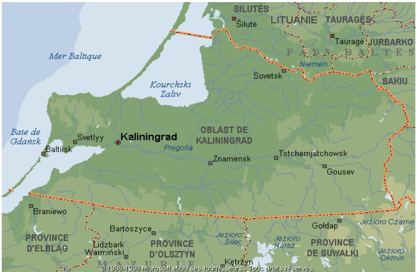
Carte n° 1 Kaliningrad – Géographie physique