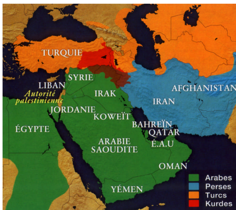
Illustration n° 1 – Étendue géographique de la Perse

La région du Proche-Orient, objet de la présente analyse, comporte les États arabes d'Égypte, de Syrie, du Liban, d'Irak, de Jordanie, d'Arabie Saoudite ainsi que du Koweït. Pour des raisons de géographie et de politique, la Turquie, Israël et l'Iran y seront associés. Les pays du Maghreb et le Soudan ainsi que les émirats du Golfe persique, encore occupés à l'époque par la Grande-Bretagne, ne seront pas pris en considération.