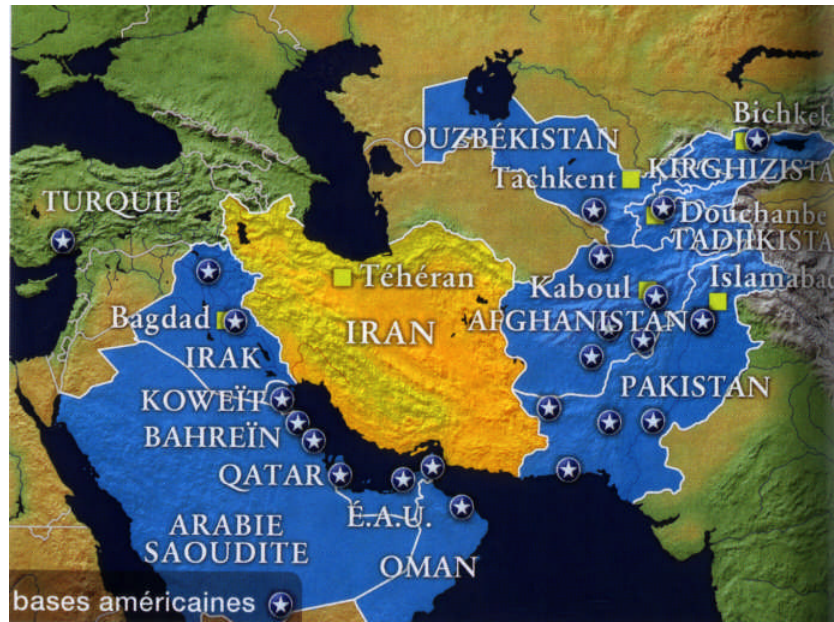
Illustration n° 4 – Présence militaire des Etats-Unis dans l'environnement de l'Iran